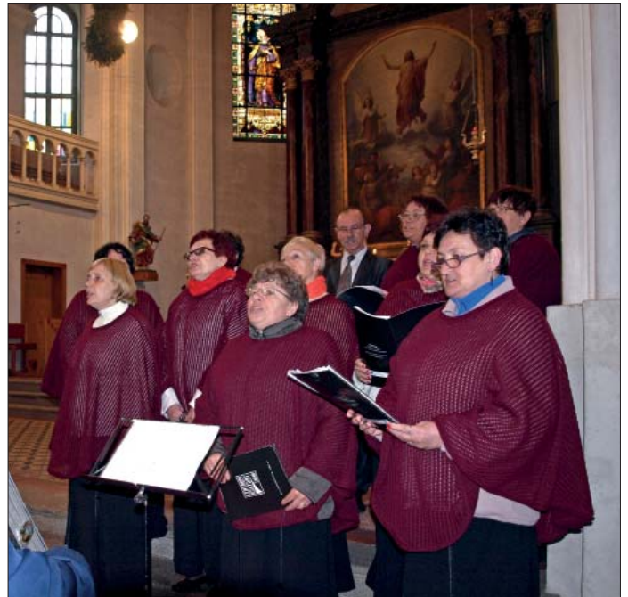
Hudźbna skupina z Pólskeje wobrubu wopomnjensku Božu mšu w Chrósćicach.