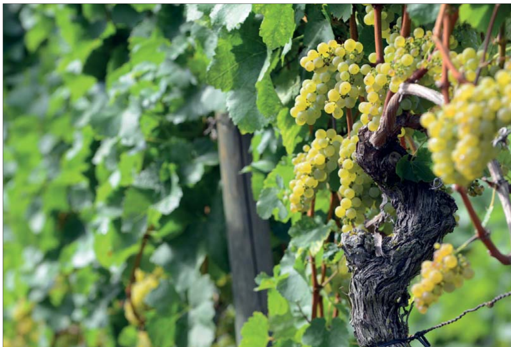
Bjez pjenka njemóže prućo płody njesć.

W tutych tydženjach zaběramy so z nowinkami a powědamy wo změnach w našich wosadach. Budže wšitko hinak? Što wostanje? Što chcemy, zo by wostało? Hdže móhlo so něšto změnić? To su prašenja, z ko-