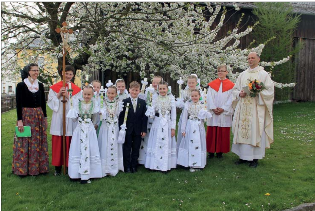
Wosom holcow a jeničkeho hólca přewodžeše farar Gabriš Nawka we Wotrowje přeni raz k blidu Božemu.

Prěnje swjate woprawjenje we Wotrowskej wosadze