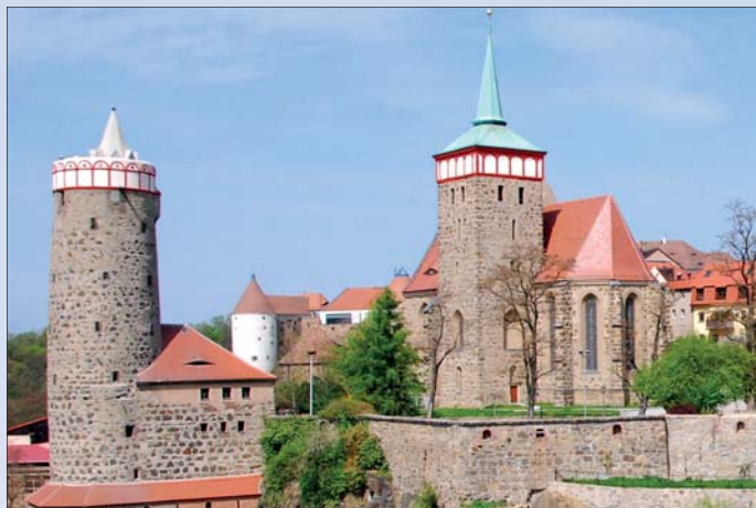
Mała kulowata swěta wěža srjedža je tak mjenowana Frohnfeste w Budyšinje.