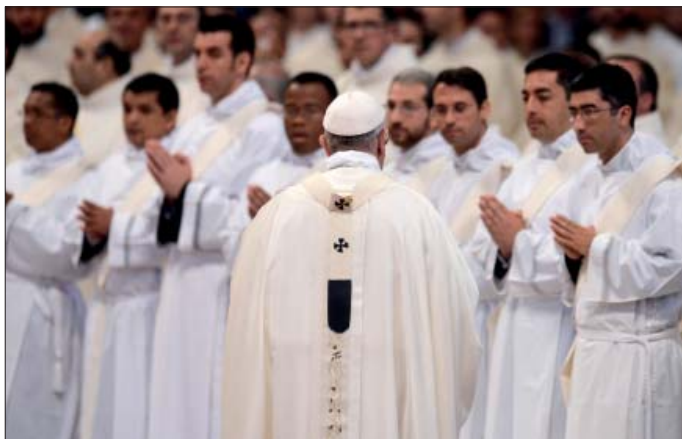
Bamž da nowoměšnikam jasne słowa na puć.

Wosebje sakrament pokuty je bamž nowym měšnikam na wutrobu kładł. „Wy sće w spowědnym stole, zo byšće wodawali, nic zo byšće zasudžowali“, rjekny jim swjaty wótca. Potom poručil přédowanja derje př-