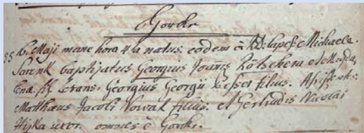
Wujimk z Chróscanskeje křćenскеje knihi

Jurjo, Jurko abo Juro, njewěmy, kak su staršej a wjesnjenjo hólců wołali, kotryž je so lětsa w meji před 240 lětami w Hórkach narodził. Móžeš džensa hišće zapisanje křćenicy w Chróscicach na farje w křćenскеj knize pod lětom 1775 čitać: „16. maji mane hora 4ta natus, eodem die a R.