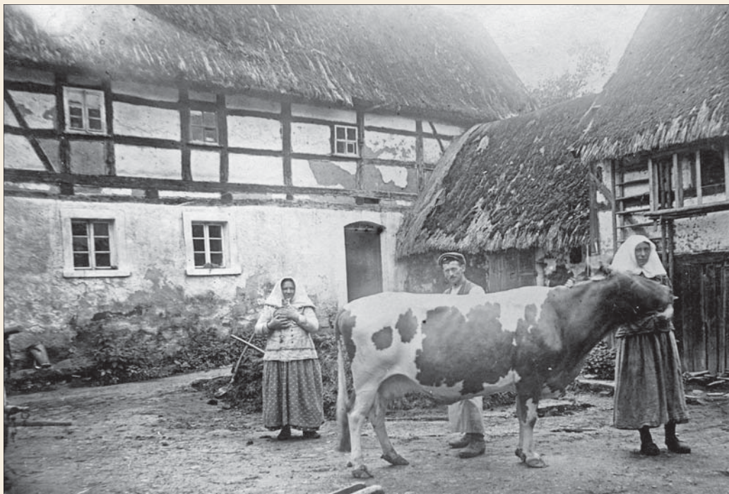
Něhdyši Šěrcec statok w Hórkach (džensa Elic)

dorfa (džensa Vilémov u Šluknova) putnikuje.