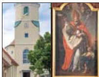
Wosada swjateho Bena, Wotrow