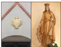
Wosada swjateje Katymy, Ralbicy