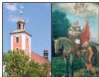
Wosada swjateho Měrcina, Njebjelčicy