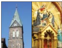
Wosada Marije kralowny róžowca, Radwor