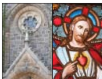
Wosada Jězusoweje wutroby, Bačoń