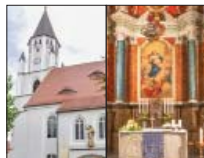
Wosada Marije donjebjeswzača, Kulow